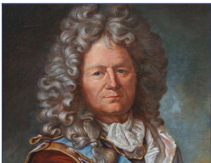
Sébastien LE PRESTRE, marquis de Vauban.

Conquise par Louis XIV le 27 août 1667, la ville de Lille est formellement rattachée au royaume de France par le traité d'Aix-La-Chapelle le 2 mai 1668. Une citadelle, dont la conception est confiée à Sébastien LE PRESTRE, marquis de VAUBAN y est édifiée dans les années qui suivent.