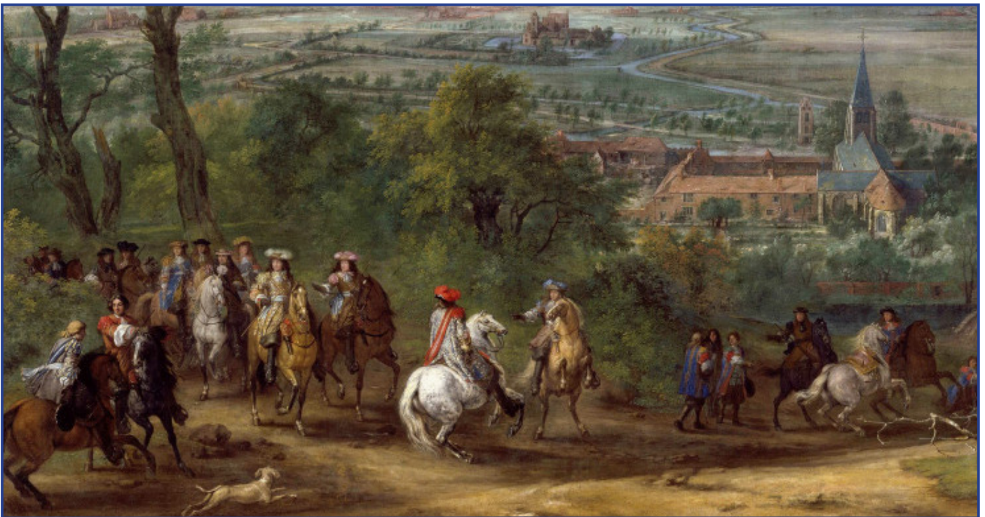
Arrivée de Louis XIV au siège de Lille, en vue du prieuré de Fives, 9-27 août 1667 - Photo (C) RMN-Grand Palais.

En mai 1667, face au refus des Espagnols, le monarque français lève une armée d'environ 40 000 hommes qu'il conduit lui-même avec le soutien du Maréchal d'Aumont. On sollicite le jeune ingénieur Sébastien le Prestre de Vauban qui fait creuser les premières tranchées entre la Porte de Fives, la Noble Tour et la Porte Saint Sauveur.