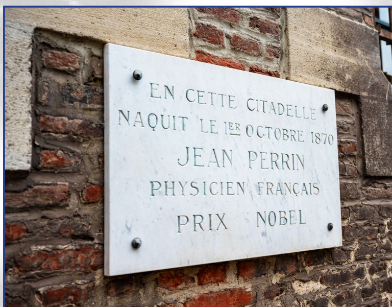
Plaque de la citadelle.

Lors de la Seconde guerre mondiale, réunissant ses camarades dreyfusards, Jean Perrin s'oppose ouvertement au nazisme avant de fuir aux USA où il meurt en 1942. Ses cendres seront rapatriées en 1948, et reposent avec celles de Paul Langevin, au Panthéon.