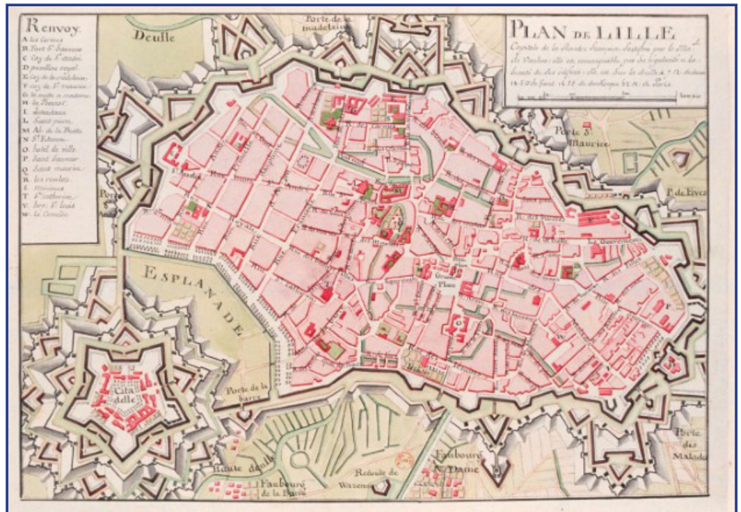
Carte du XVIII e siècle du vieux Lille et de la citadelle Vauban.

Cependant le roi n'attendit pas que la ville soit rattachée au royaume de France pour ordonner la construction de la Citadelle de Lille. Il laisse carte blanche à Vauban dont il apprécie le franc parler pour renforcer et moderniser les fortifications. Désormais le soldat ne sera plus logé chez l'habitants mais directement « encaserné » dans la Citadelle, faisant d'elle la première caserne de France. Il révolutionne la doctrine militaire défensive de la France avec la réalisation de la « ceinture de fer » du Pays : renforcement des nouvelles frontières avec l'acquisition de places fortes (180 au total) créant une double ligne de villes fortifiées faisant face aux Pays-Bas espagnols.