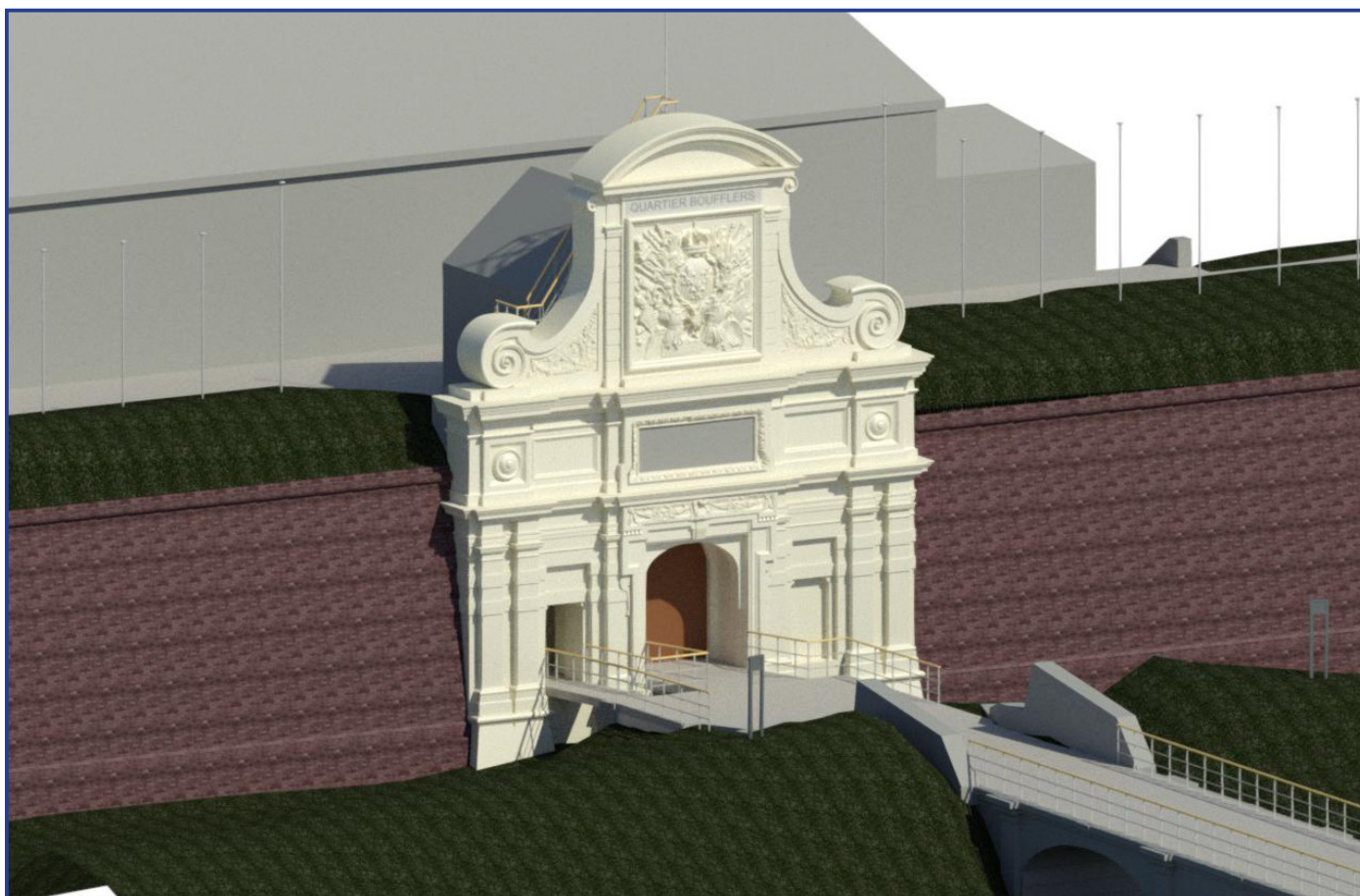
Un modèle numérique de la Porte Royale - ©MA_GEO.

Grâce à cela, deux volets du projet ont été lancés : l'éclairage architectural de la Porte Royale et la restauration de la demi-lune royale. Les contributions financières sont la forme la plus courante de participation à une opération de mécénat ; elles offrent une liberté d'action indispensable à la conduite du projet et couvrent le gros des travaux à entreprendre. Cependant, il existe également une forme moins connue de participation, pourtant particulièrement bénéfique : celle du mécénat de compétence ou en nature. Ainsi, l'opération d'éclairage de la Porte Royale a démarré par la mise en œuvre gracieuse de leurs savoir-faire par deux entreprises de la région : la société MA-GEO, cabinet de géomètres experts et bureau d'étude en génie civil, a créé un modèle numérique de la Porte Royale. C'est maintenant le tour de la société CANDELIANCE, spécialisée dans l'éclairage et l'aménagement des espaces publics de proposer, en s'appuyant sur le travail de MA-GEO, des solutions artistiques et techniques pour atteindre l'objectif de mise en valeur nocturne de la Porte Royale.